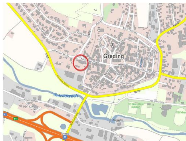
Lageplan (ohne Maßstab)

Ortsüblich bekannt gemacht durch Anschlag an der Amtstafel Greding und in allen Ortsteilen, sowie im Internet unter www.greding.de/aktuelles .