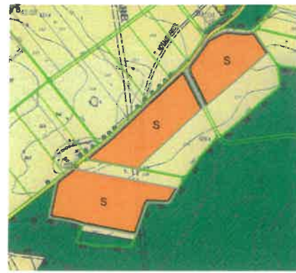
Lageplan 25. Änderung des Flächennutzungsplanes (ohne Maßstab)

Ortsüblich bekannt gemacht durch Anschlag an der Amtstafel Greding und in den betroffenen Ortsteilen, sowie im Internet unter www.greding.de/aktuelles .