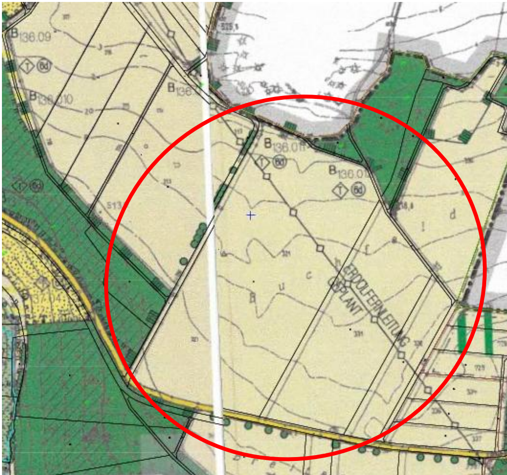
Ausschnitt aus dem wirksamen Flächennutzungsplan mit Abgrenzung des Änderungsbereiches (nicht maßstäblich)

Die Stadt Greding verfügt über einen wirksamen Flächennutzungsplan mit Landschaftsplan. Dieser stellt innerhalb der beiden Änderungsbereiche Flächen für die Landwirtschaft (Acker) dar. Nördlich und südlich des Plangebiets sind Waldflächen dargestellt. Weitere Zielaussagen sind durch den Flächennutzungsplan mit integriertem Landschaftsplan innerhalb des Geltungsbereiches nicht definiert.