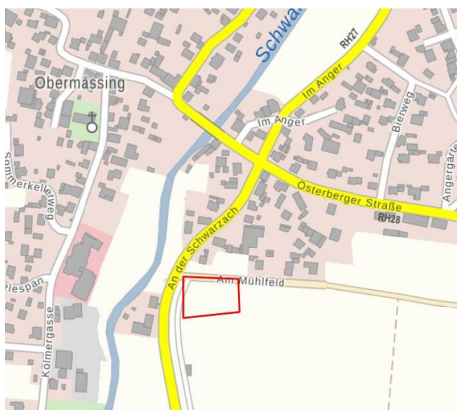
Lageplan (ohne Maßstab) [© Bay. Vermessungsverwaltung 2023]

Ortsüblich bekannt gemacht durch Anschlag an der Amtstafel Greding und in allen Ortsteilen, sowie im Internet unter www.greding.de/aktuelles .