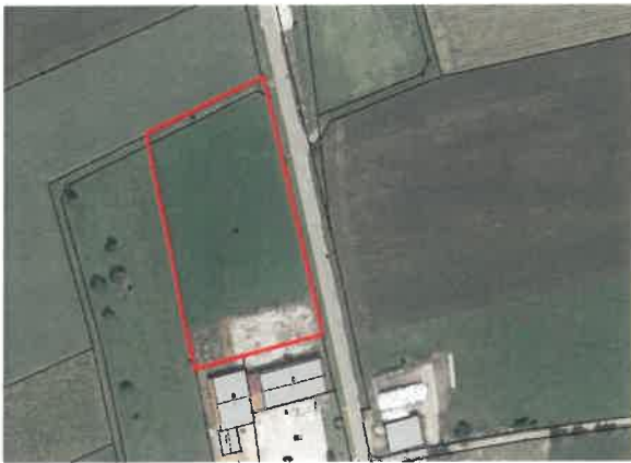
Lageplan des B-Plan Nr. 73 „Gewerbegebiet Mühleek“ in Schutzendorf (ohne Maßstab)